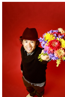
ナオト・インティライミ