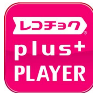
「レコチョク plus+」アプリアイコン

※「着うた®」「着うたフル®」「着うたフルプラス®」は、株式会社ソニー・ミュージックエンタテインメントの登録商標です